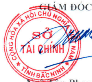
Ngô Tân Phụng